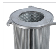
Jet3 & Jet4